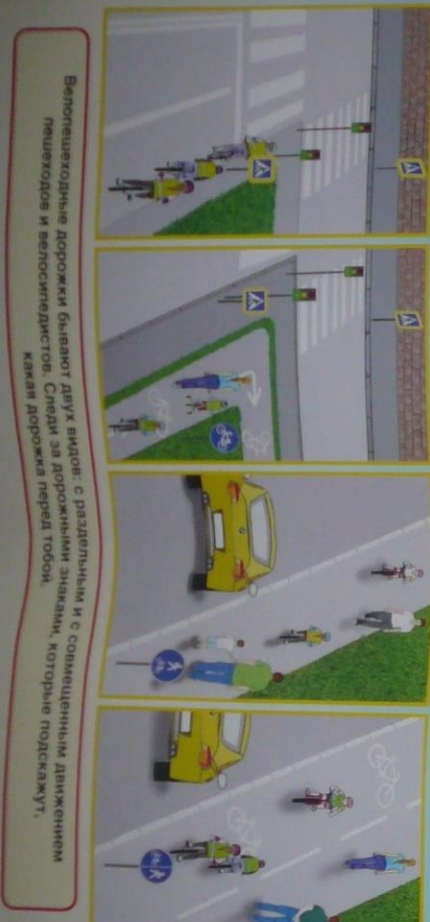
Велопешеходные дорожки бывают двух видов: с разделителями и с совмещенным движением пешеходов и велосипедистов. Сиди за дорожными знаками, которые подскажут, какая дорожка перед тобой.